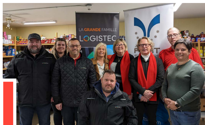
Noël des enfants de l'OMHSI Grande guignolée des médias Marathon Mamu