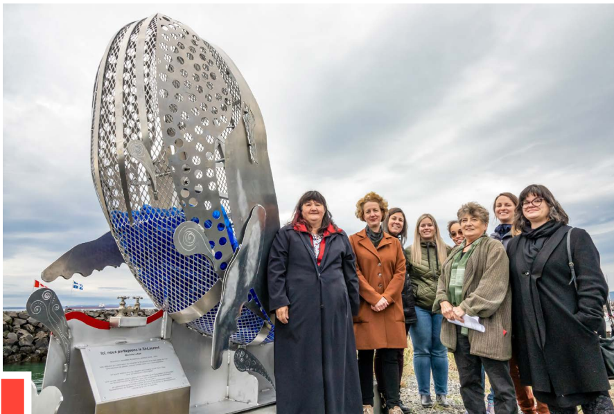
Sculpture réalisée par l'artiste Michelle Lefort dans le cadre de la campagne « Ici commence le St-Laurent ».

Le Port continue d'apporter son soutien aux organismes environnementaux locaux. Cette année, le Port a contribué à la campagne de sensibilisation «Ici commence le Saint-Laurent!» initiée par la Corporation de protection de l'environnement de Sept-Îles, ainsi qu'à la restauration de la frayère à capelans dans le secteur Sainte-Marguerite, un projet mené par le Comité ZIP Côte-Nord du Golfe débuté l'an dernier et qui s'est finalisé en 2022.